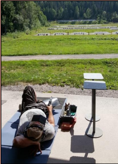
Die typische liegende Position „Dead Frog“, die eine sehr lange und genaue Visierlinie bietet.

Beim Silhouetten-Schießen wird auf spezielle Stahlziele in Tierform (Huhn, Schwein, Truthahn und Widder) geschossen, und zwar auf jeweils unterschiedliche Entfernungen. Die Auswertung ist ganz einfach: nur eine umgeworfene Figur zählt als Treffer, ein Wettkampf geht über 40 Schuss.